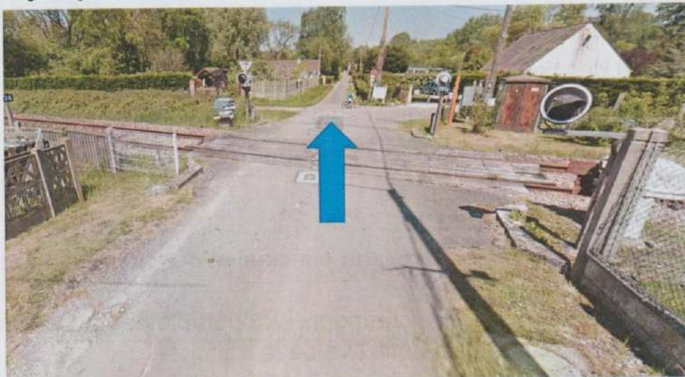
Forage dirigé sous voie SNCF