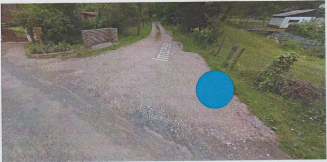
Implantation poste de refoulement