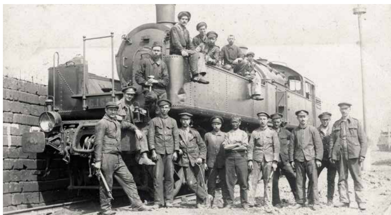
Les équipes anglaises devant la Coco articulée