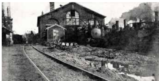
Le dépôt après un bombardement

et des avions allemands, l'étoile de Saint-Pol tient son rôle. Les lignes Anvin–Calais et Ayre-sur-la Lys (Montreuil–Berck) sont placées sous contrôle anglais. La gare d'Étaples assurant le « dispatch », les trains montent d'Abbeville à Saint-Pol. À Beaurainville, un vaste dépôt-atelier de locomotives en voies de 60 est construit. Une voie normale est établie de Hesdin à Frevent. Un triage dit « Erin–Teneur » est construit pour accueillir l'« usine des tanks ». De nombreux trains en provenance du Camp Vendroux parviennent à Anvin. La voie normale Saint-Pol–Fouquereuil est triplée, voire quadruplée à certains endroits et la ligne Brias–Bully/Grenay est doublée jusqu'aux puits de mine.